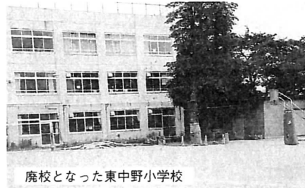
廃校となった東中野小学校

東中野地域センターは、東中野小学校跡に(仮)区民活動センターとして開設。これまでの窓口業務は自動交付機によって住民票などの発行を行なう。