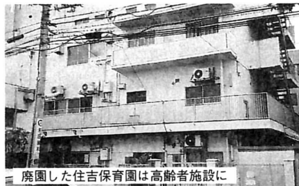
廃園した住吉保育園は高齢者施設に